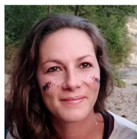
Madu Pech > Animation